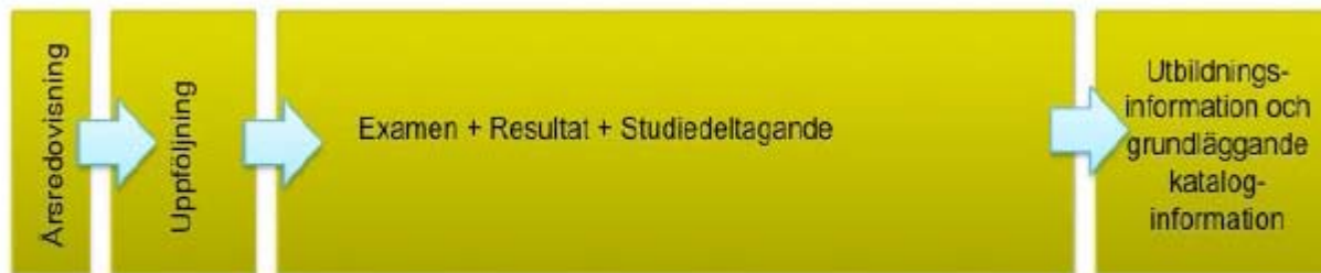
Figur 2: Driftsättningsordning för Ladok3 i produktionsmiljö.

Verksamhetsmässigt: Våldigt stor tyngdpunkt på steg 3.